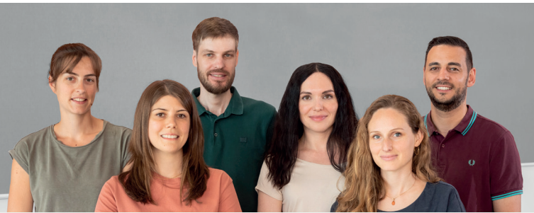
Das Psycholog*innen-Team der PBS / The counseling team of the PBS